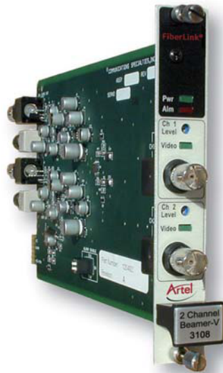
図2を参照してください。Beamer-V デュアルチャンネルカードバージョン（送信機 P/N 3108、受信機 P/N 3109）は、Beamer-V ボックスユニット（送信機 P/N 3100、受信機 P/N 3101）と組み合わせて使用することができます。1台以上のカードユニットをボックスユニットに接続する場合は、本書の反対側を参照してシステムの設置方法を確認してください。